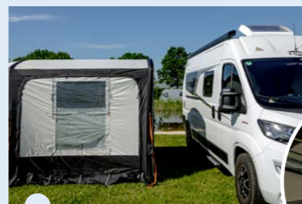
Vaste petluifel aan de voorzijde

De tent en bus staan los van elkaar. De sluis is het flexibele tussenstuk