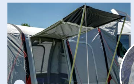
Kleuraccenten vrolijken de boel op

De zijwanden hebben handige luifelopties