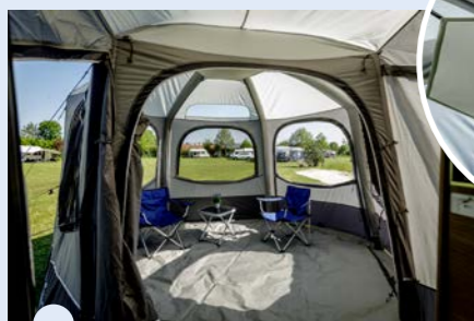
Hemeltje in de nok

Door de zes hoeken heb je op de camping een panorama-uitzicht